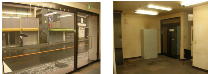
【室内写真】 ※過去の写真です※