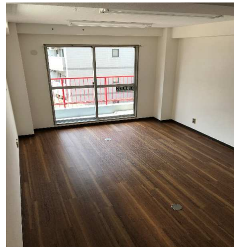
【402号室 リフォーム済】