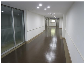
【1階 中央通路 (改修済)】