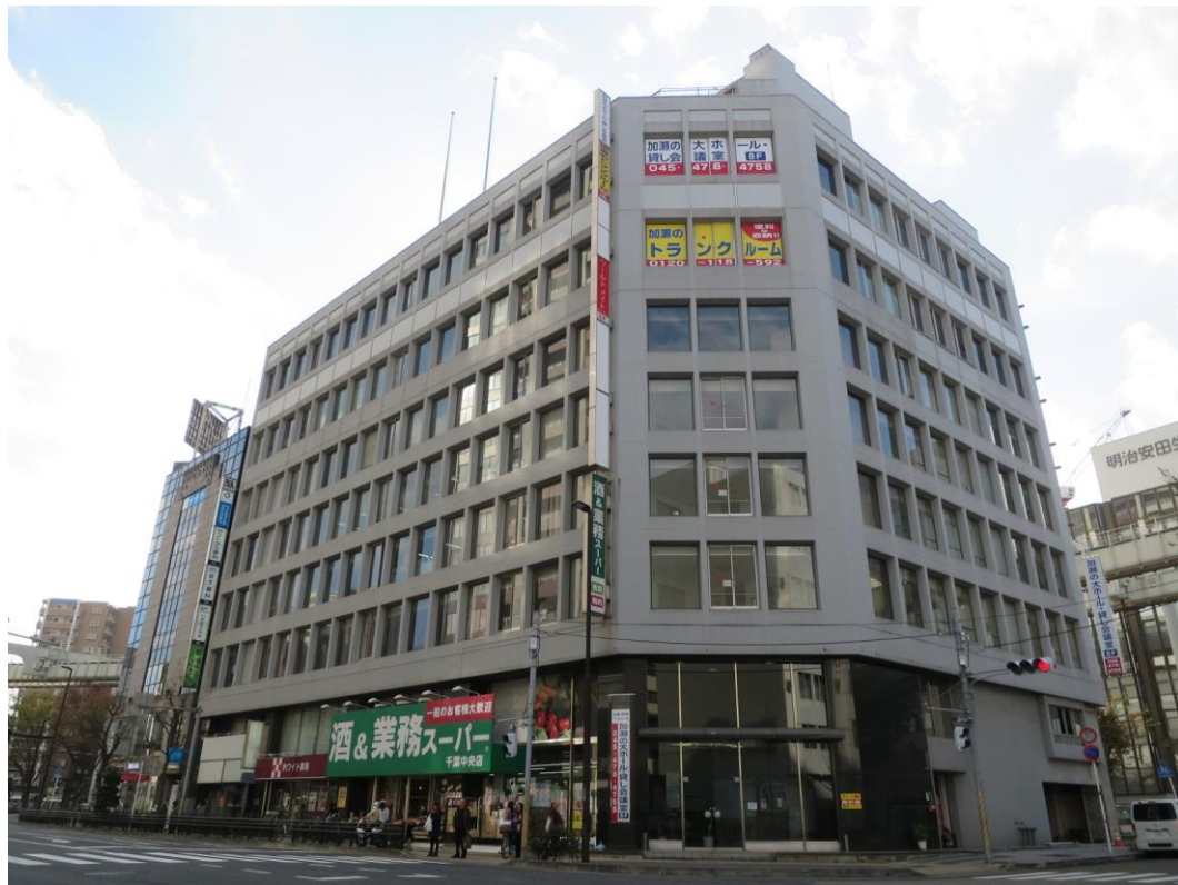
【外観写真】1階 酒&業務スーパー 地下1階 地域最大屋内型トランクルーム OPEN予定