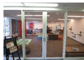
【303号室 猫カフェ MYAO】

※図面と現況が異なる場合は、現状優先とさせていただきます。※内見の際は必ず当社へご連絡ください。(ご契約済の場合はあしからずご了承ください)