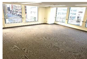
【304号室 室内*二面採光】

月額賃料/135,000円(税込) 共益費/45,360円(税込) 機械警備料/16,200円(税込) 保証金/3ヶ月(解約時償却1ヶ月) 礼金/1ヶ月 入居日/即日 最適用途/店舗・事務所 ※2年契約更新可、更新料は新賃料の1ヶ月 ※指定保証会社加入義務有り