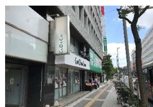
【1階 店舗外観】 *Cut Only Club 6月OPEN