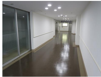
【1階 中央通路（改修済）】