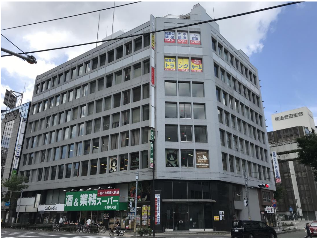
【外観写真】1階 酒&業務スーパー、8階 大型イベントホール、会議室 地下1階 フィットネススタジオ OPEN予定