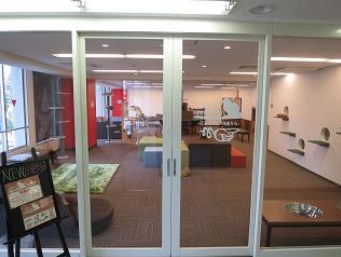
【303号室 猫カフェ MYAO】