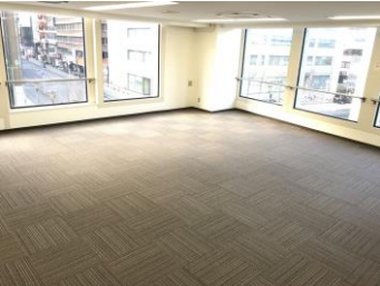
【304号室 室内*二面採光】

【店舗構成】1階 酒&業務スーパー 千葉中央店、Cut Only Club 千葉中央店 3階 猫カフェ MYAO、地下1階 カルド 千葉中央店