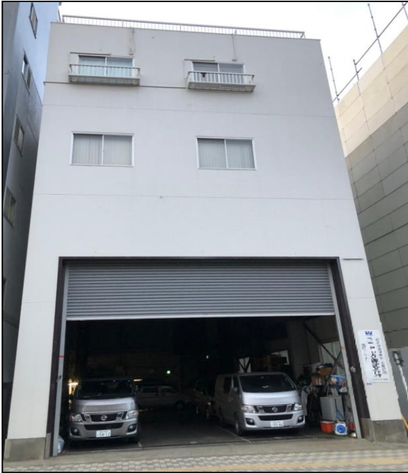
写真は現地イメージ