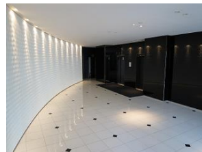
高級感溢れるエントランス