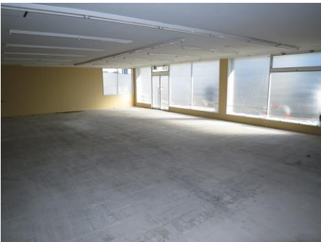
【室内写真】 ※壁ボード張替、天井塗装実施