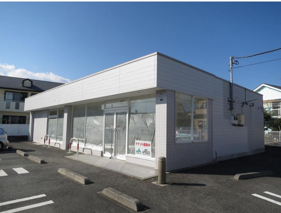
【外観写真】 ※外壁目地コーキング、一部塗装実施