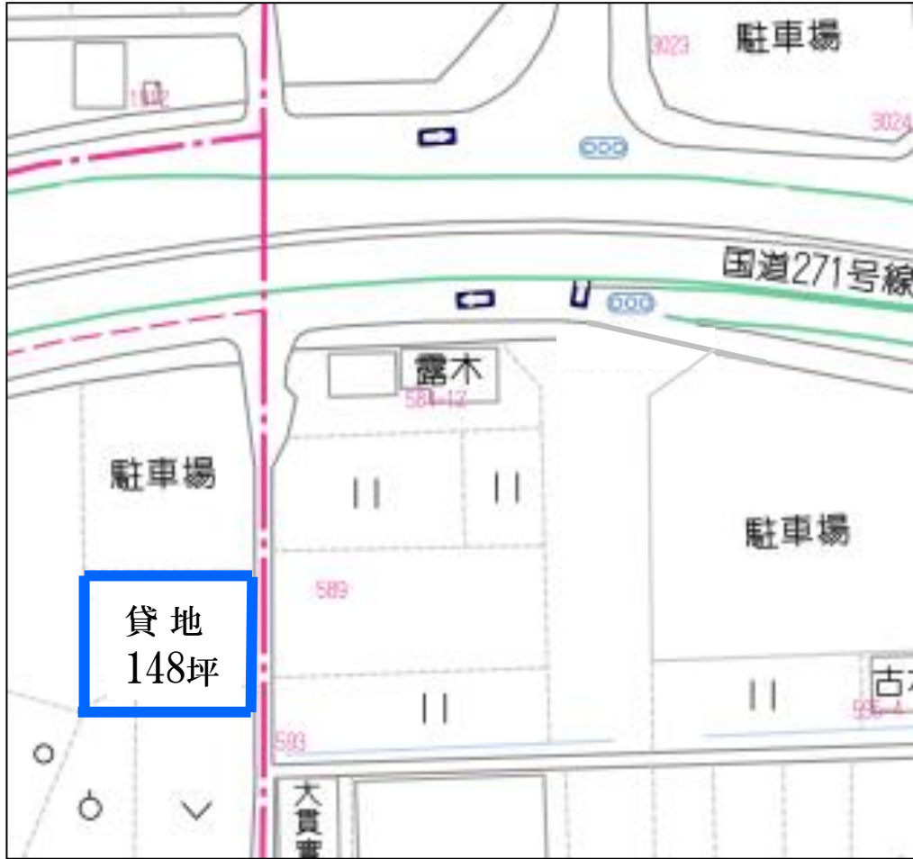
※図面と相違する場合は現況を優先いたします。